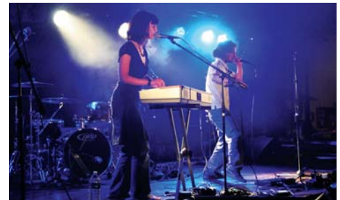
Groupe "Mû" gagnant du Tremplin