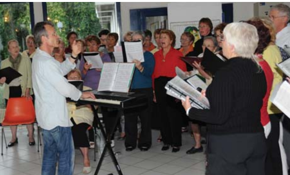
Chorale La Pastourelle

Ce samedi 19 juin, les concerts de la fête de la musique de Portes-lès-Valence ont dû être transférés à la salle Georges Brassens et au centre culturel Aragon, en raison d'un temps incertain. Mais, malgré cela, elle eut bien lieu.