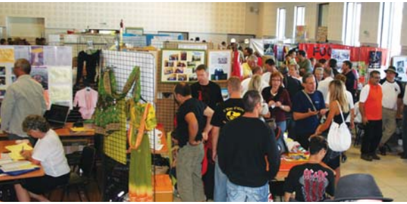
Forum des associations, édition 2009

Le vendredi 3, samedi 4 et dimanche 5 septembre